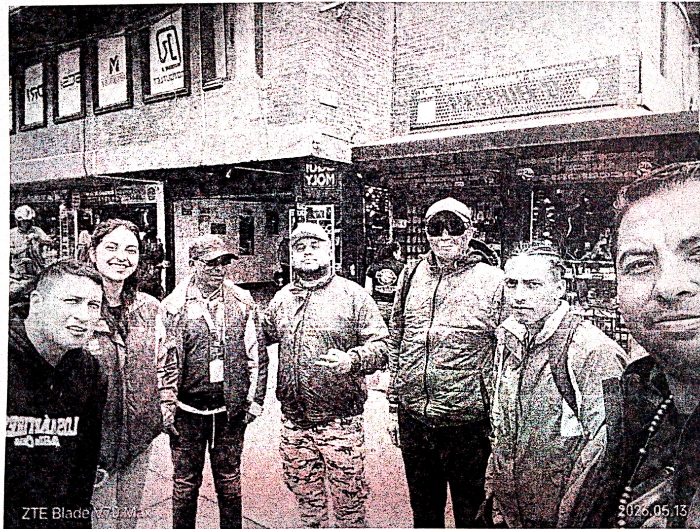
Alcaldía Local Los Mártires